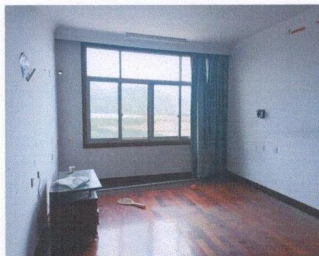
估价对象内部状况