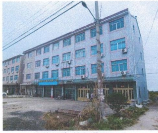
估价对象外部状况