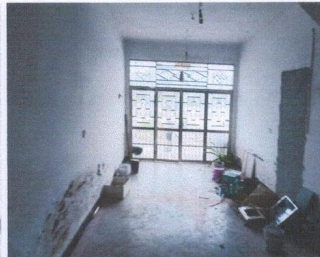
估价对象外部状况