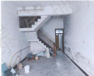
估价对象外部状况