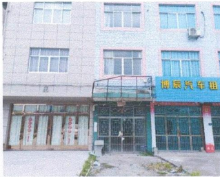
估价对象外部状况