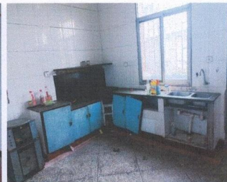
估价对象内部状况