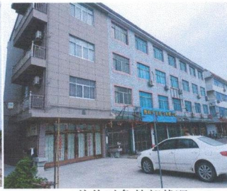
估价对象外部状况