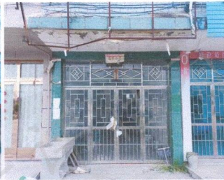
估价对象外部状况